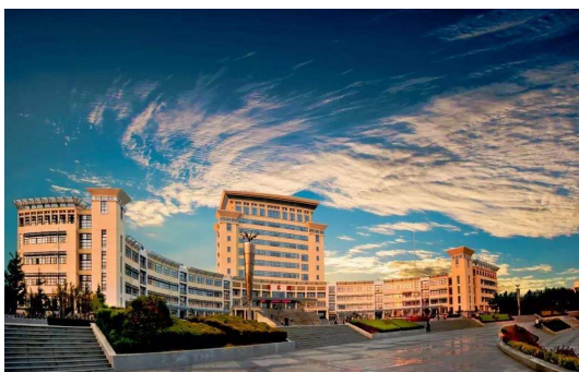
图 4.5: 威海校区的图书馆