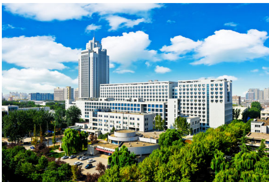
图 4.1: 知新楼上的袅袅轻云