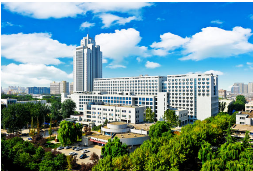
图 3.1: 知新楼上的袅袅轻云