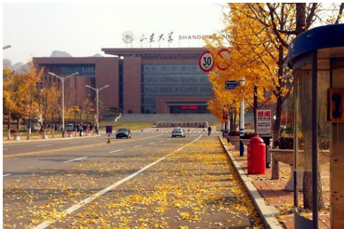
(a) 先志大道的萧萧落叶