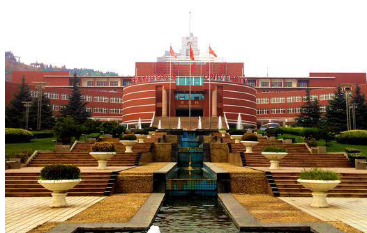
图 4.4: 软件园区的日新月异