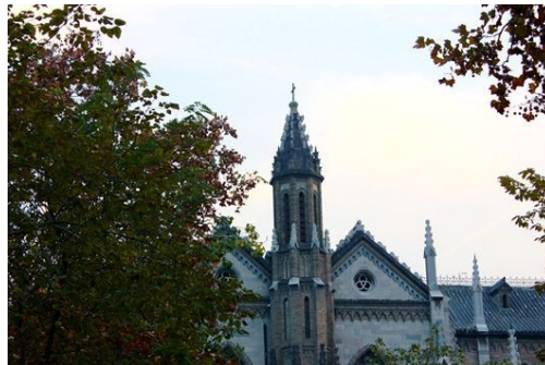
(b) 洪楼教堂的呢喃钟鸣