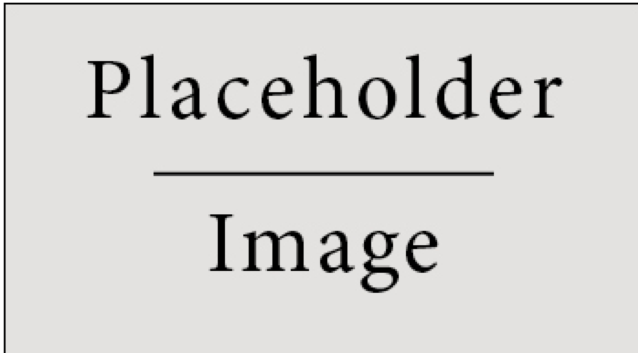
Figure 1: Figure caption

Nulla ut porttitor enim. Suspendisse venenatis dui eget eros gravida tempor. Mauris feugiat elit et augue placerat ultrices. Morbi accumsan enim nec tortor consectetur non commodo. Pellentesque condimentum dui. Etiam sagittis purus non tellus tempor volutpat. Donec et dui non massa tristique adipiscing. Quisque vestibulum eros eu. Phasellus imperdiet, tortor vitae congue bibendum, felis enim sagittis lorem, et volutpat ante orci sagittis mi. Morbi rutrum laoreet semper. Morbi accumsan enim nec tortor consectetur non commodo nisi sollicitudin.