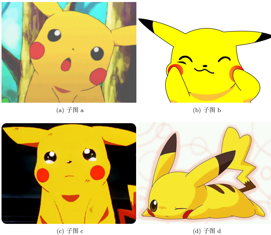
图 2.2: 子图示例