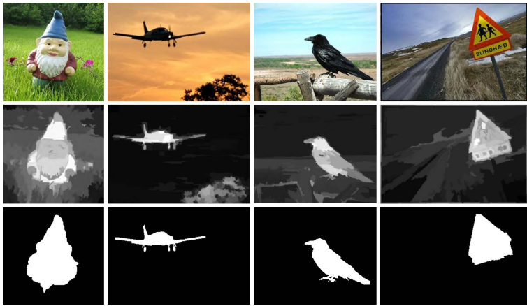
图 2: 短题注。