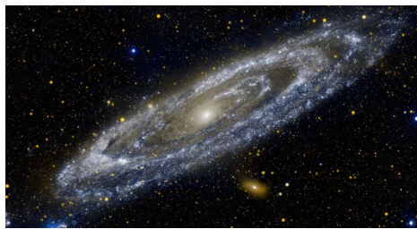
(a) – Very very long caption for a subfigure. This is setup with subcaption package.

Ut porttitor. Praesent in sapien. Lorem ipsum dolor sit amet, consectetur adipiscing elit. Duis fringilla tristique neque. Sed interdum libero ut metus. Pellentesque placerat. Nam rutrum augue a leo. Morbi sed elit sit amet ante lobortis sollicitudin. Praesent blandit blandit mauris. Praesent lectus tellus, aliquet aliquam, luctus a, egestas a, turpis. Mauris lacinia lorem sit amet ipsum. Nunc quis urna dictum turpis accumsan semper. Qu'est que c'est?. C'est une phrase français avant le lorem ipsum. Lorem ipsum dolor sit amet, consectetur adipiscing elit. Etiam lobortis facilisis sem. Nullam nec mi et neque pharetra sollicitudin. Praesent imperdiet mi nec ante. Donec ullamcorper, felis non sodales commodo, lectus velit ultrices augue, a dignissim nibh lectus placerat pede. Vivamus nunc nunc, molestie ut, ultricies vel, semper in, velit. Ut porttitor. Praesent in sapien. Lorem ipsum dolor sit amet, consectetur adipiscing elit. Duis fringilla tristique neque. Sed interdum libero ut metus. Pellentesque placerat. Nam rutrum augue a leo. Morbi sed elit sit amet ante lobortis sollicitudin. Praesent blandit blandit mauris. Praesent lectus tellus, aliquet aliquam, luctus a, egestas a, turpis. Mauris lacinia lorem sit amet ipsum. Nunc quis urna dictum turpis accumsan semper.