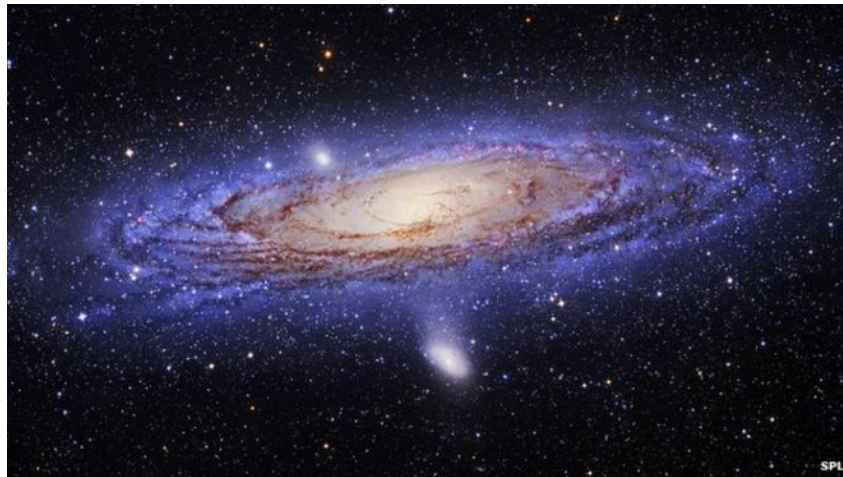
Figure I.1 – caption