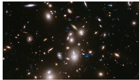
(b) – Short caption